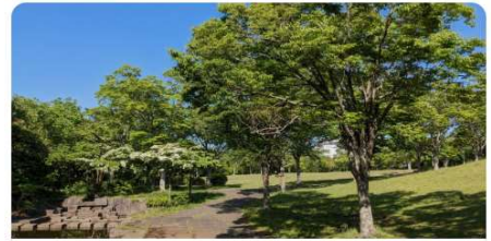
ちはら台南5丁目自治会